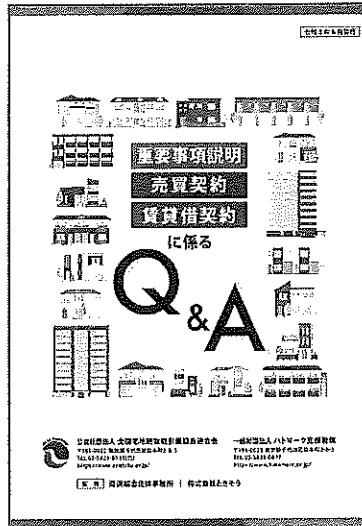
冊子仕様:A4・128ページ・フルカラー