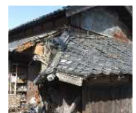
緊急代執行を要する 崩落しかけた屋根